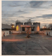
Deposito di Casal di Principe

Formare professionalità e valorizzare l'eccellenza è l'obiettivo che Virvelle persegue da sempre, con un'offerta che negli anni si è arricchita di servizi HR quali: assessment, definizione modelli di competenze, creazione di piani di sviluppo competenza (PISC) e incentive. Unico nel suo genere il servizio formativo sul "passaggio generazionale", che consente alle nuove generazioni di prendere saldamente le redini dell'azienda di famiglia. Ogni azione formativa si trasforma in un'esperienza attraverso tecniche che valorizzano l'esperienza, senza escludere il trasferimento di nozioni. Unica anche la piattaforma Virvelle dedicata al coworking, stile di lavoro basato sulla condivisione di valori, spazi e conoscenze. Qualsiasi siano gli obiettivi da perseguire nel coworking Virvelle ci sono gli spazi, i servizi e un'intera community pronta a offrire supporto e valide collaborazioni. Il tutto mantenendo autonomia e flessibilità, per uno scambio di idee, progetti e competenze che facilita l'aggregazione di opportunità. www.virvelle.com e www.coworking.virvelle.com